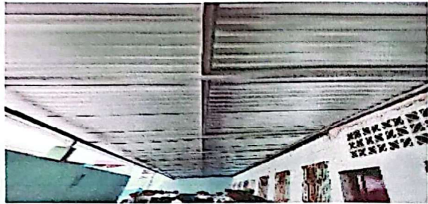
Foto 1: Suministro y sustitución de estructura de techo con costanera galvanizada