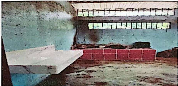
Foto 4: Suministro e instalación de mesa flotante de concreto cocina