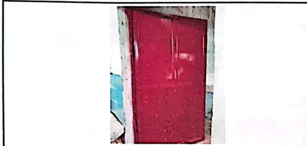
Foto 7: Suministro e aplicación de pintura en puerta de cocina y cambio de chapa