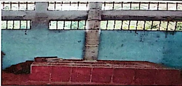
Foto 6: Suministro e instalación de forro de baldosas de barro en estufa rural

Observación: Si es necesario se pueden agregar hojas adicionales y actualizar el número de hojas.