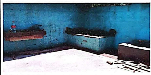
Foto 4: Suministro e instalación de mesa flotante de concreto cocina