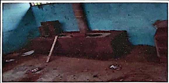
Foto 6: Suministro e instalación de forro de baldosas de barro en estufa rural

Observación: Si es necesario se pueden agregar hojas adicionales y actualizar el número de hojas.