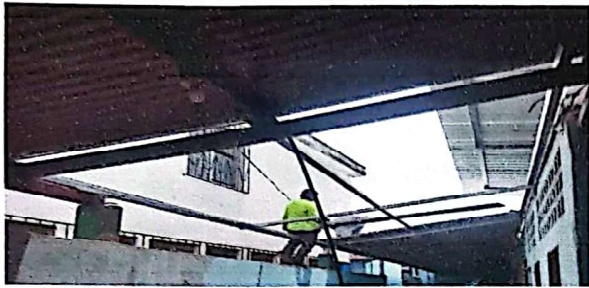
Foto 1: Suministro y sustitución de estructura de techo con costanera galvanizada