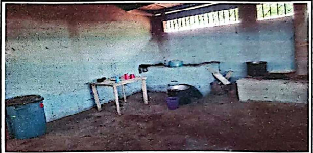
Foto 4: Suministro e instalación de mesa flotante de concreto cocina