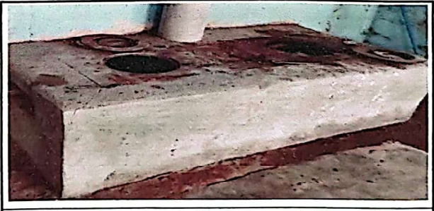
Foto 6: Suministro e instalación de forro de baldosas de barro en estufa rural

Observación: Si es necesario se pueden agregar hojas adicionales y actualizar el número de hojas.