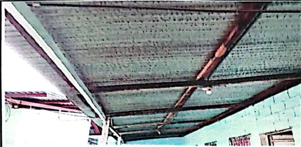
Foto 1: Suministro y sustitución de estructura de techo con costanera galvanizada