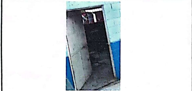
Foto 7: Suministro e aplicación de pintura en puerta de cocina y cambio de chapa