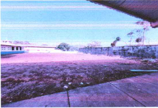
Suministro e instalacion de estructura metalica soporte de cubierta con perfiles metalicos (costaneras), Suministro e instalacion de lamina troquelada calibre 26 Módulo 3