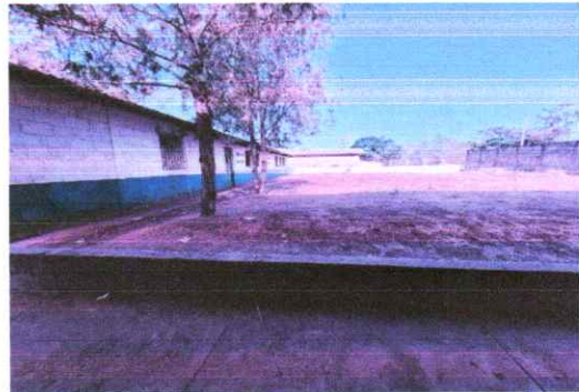
Suministro e instalacion de estructura metalica soporte de cubierta con perfiles metalicos (costaneras)

Observación: Si es necesario se pueden agregar hojas adicionales y actualizar el número de hojas.