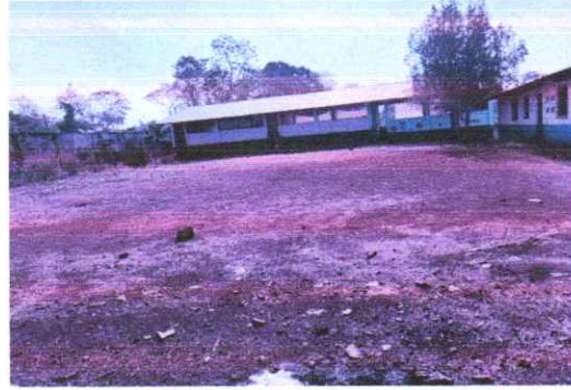
Suministro e instalacion de estructura metalica soporte de cubierta con perfiles metalicos (costaneras), Suministro e instalacion de lamina troquelada calibre 26 Módulo 3