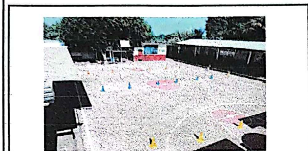
Foto 3: SUMINISTRO E INSTALACION DE CANALES Y BAJADAS DE AGUA PLUVIAL