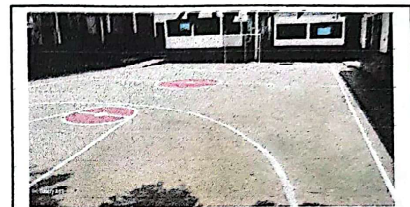
Foto 4: SUMINISTRO E INSTALACION DE BASES PARA SOPORTE DE ESTRUCTURA METÁLICA