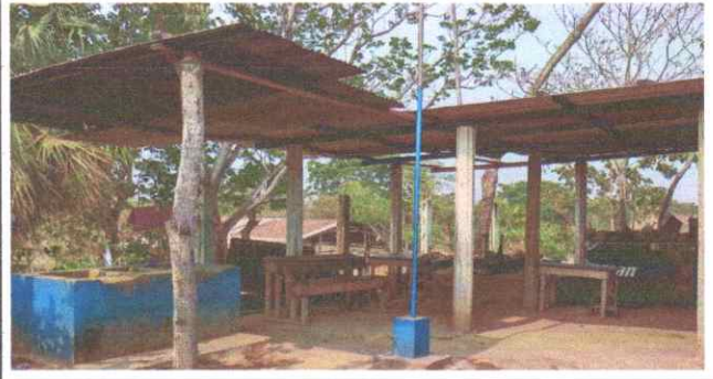
Suministro y sustitución de piso cerámico