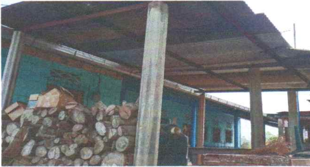
Suministro y sustitución de lámina, por lámina troquelada aluzinc calibre 26