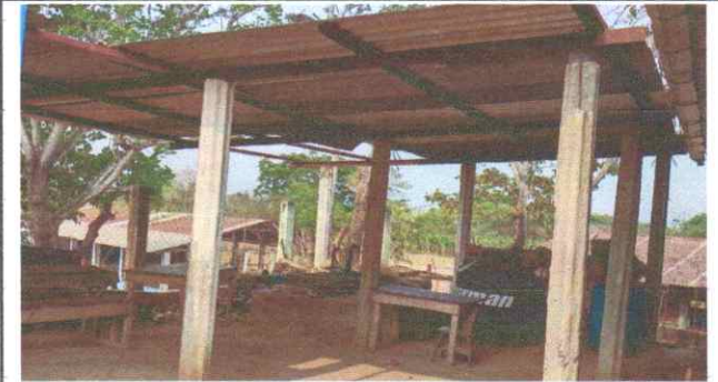
Suministro y sustitución de estufa rural

Observación: Si es necesario se pueden agregar hojas adicionales y actualizar el número de hojas.