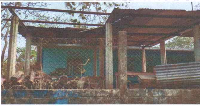
Suministro y reparación de muro de block de cocina