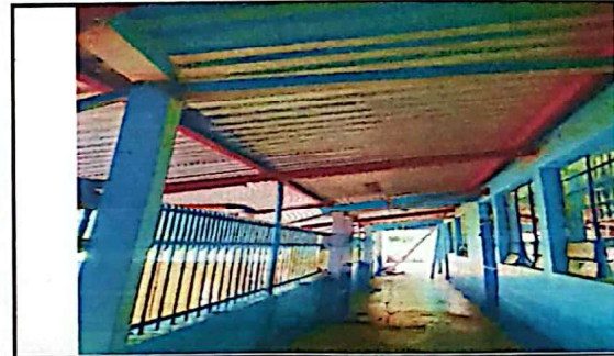
Foto 6: Mantenimiento de perfiles metalicos con anclaje a edificios y muros existentes

Observación: Si es necesario se pueden agregar hojas adicionales y actualizar el registro.