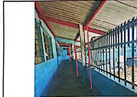
Foto 4: Mantenimiento de perfiles metalicos con anclaje a edificios y muros existentes