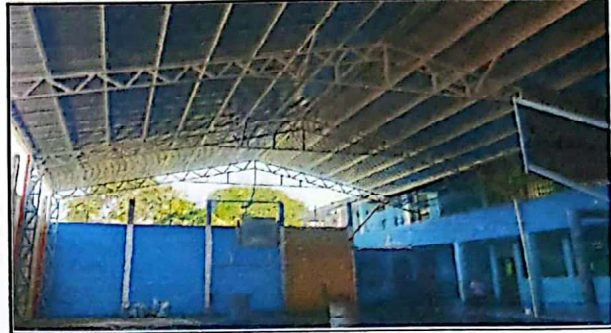
Foto 2: Mantenimiento de cancha con lamina calibre 26 y costaneras 225 m2