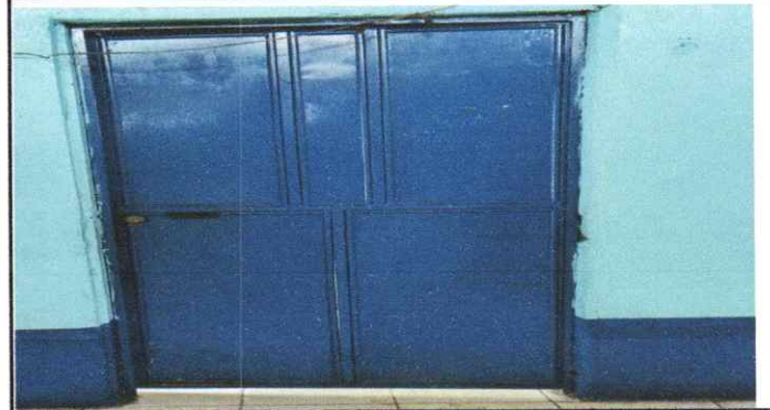
Sustitución de una de dos chapas Yale por encontrarse en muy mal estado.

servación: Si es necesario se pueden agregar hojas adicionales y actualizar el número de hojas.