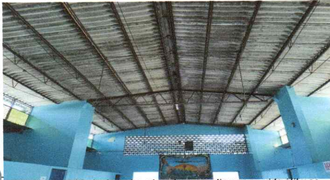
Sustitución de cubierta de techo, el cual ya cumplió con su vida útil y se encuentra en mal estado.