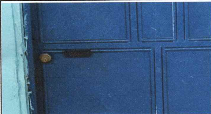
Sustitución de una de dos chapas Yale por encontrarse en muy más estado.