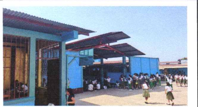
sustitución de estructura metálica de cancha # 2, pintura para aula