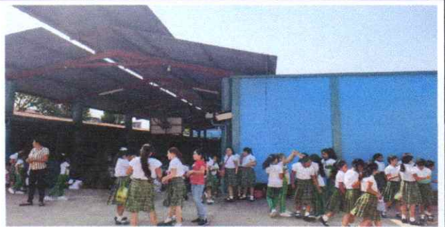
sustitución de estructura metálica, cancha # 2

Observación: Si es necesario se pueden agregar hojas adicionales y actualizar el número de hojas.