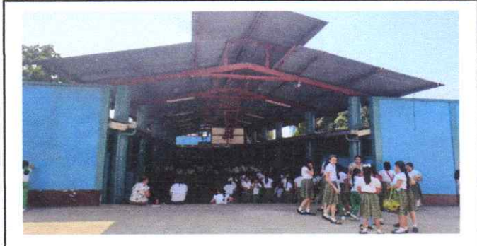
Sustitución de estructura metálica de cancha #2, pintura para aula