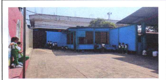
sustitución de lámina, cancha # 2