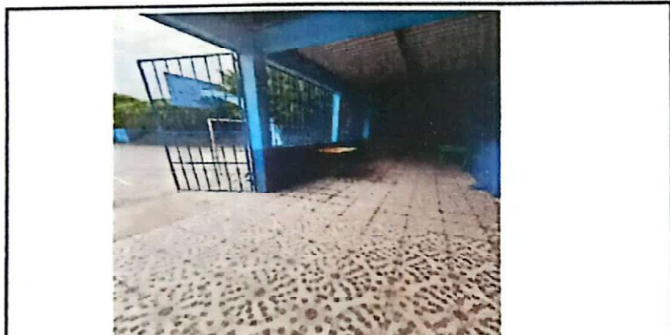
FOTO 3: Sustitucion de piso de torta de cemento por piso ceramico