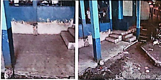
Foto 1: Suministro de piso de concreto ,gradas de concreto y repello de pared.