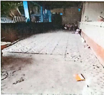
FOTO 3: Sustitución de piso de torta de cemento por piso cerámico