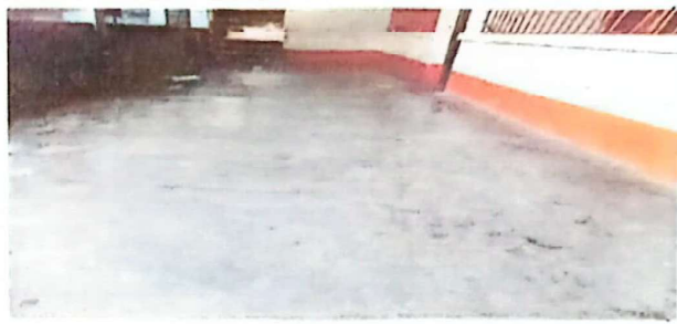
Foto 3: Sustitución de piso de torta de cemento por piso cerámico