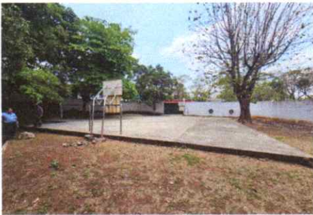
por suministro de 350 m2 de lamina troquelada para techo