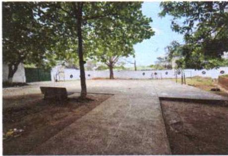
Por suministro de 10 bases de concreto para ensamble de columnas y de metal