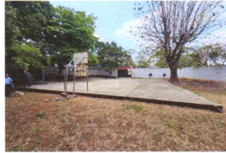
Por suministro de estructura metalica para techo