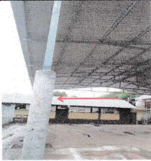
Foto 1: Suministro e instalación de cimentación para techo de patio