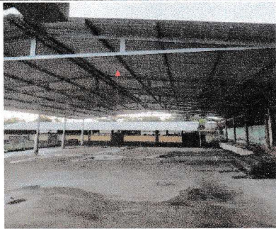
Foto 3: Suministro e instalación de lámina troqueleada Calibre 26