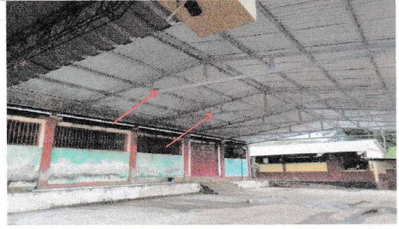
Foto 2: Suministro e instalación de estructura de metálica de patio