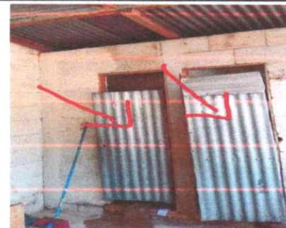
Sustitución de puertas de metal