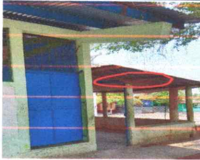
Sustitución de cubierta de lámina troquelada calibre 26, en servicios sanitarios