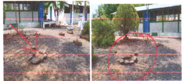
Suministro e instalación de pozo artesanal y equipo hidroneumático.

Observación: Si es necesario se pueden agregar hojas adicionales y actualizar el número de hojas.