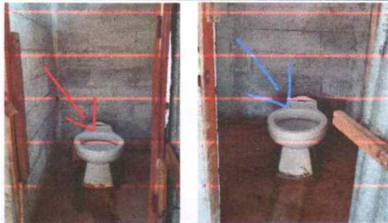
Mantenimiento de servicios sanitarios