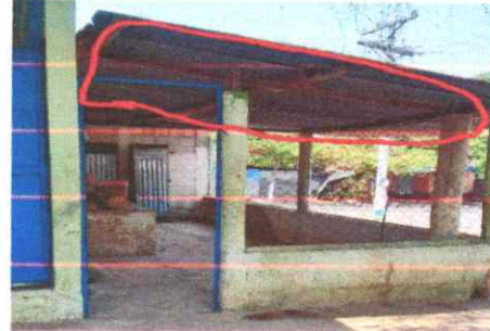
Sustitución de cubierta de lámina troquelada calibre 26, en servicios sanitarios