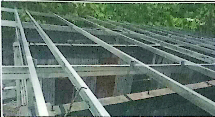
Foto1: suministro e instalacion de estructura metalica