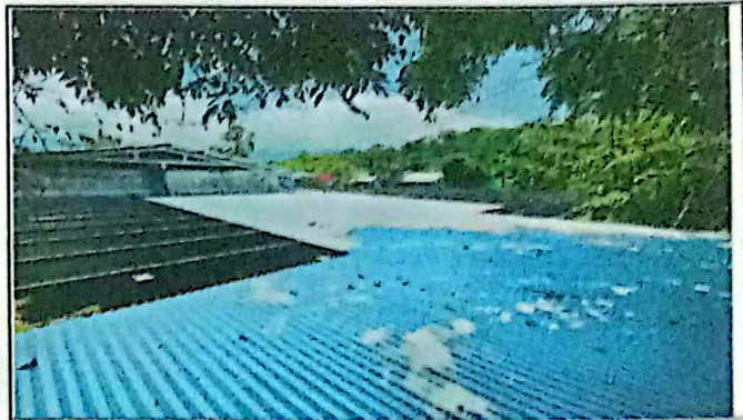
Foto 2: suministro e instalacion de lamina maxalum (c26) (0.40MM) OND G80 MDA