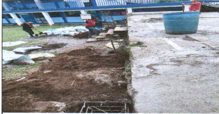
Foto1: inicio instalación estructura metálica