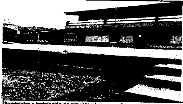
Suministro e instalación de cimentación en cancha