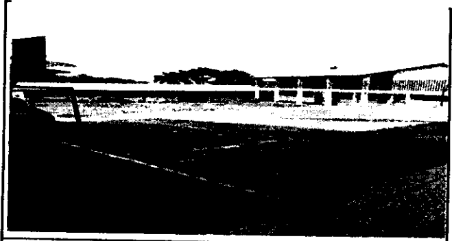
Suministro e instalación de cimentación en cancha