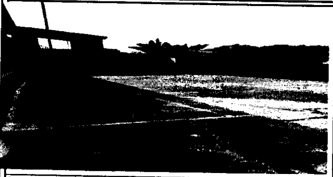
Suministro e instalación de cimentación en cancha