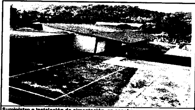
Suministro e instalación de cimentación en cancha

Observación: Si es necesario se pueden agregar hojas adicionales. Indicar el número de hojas.