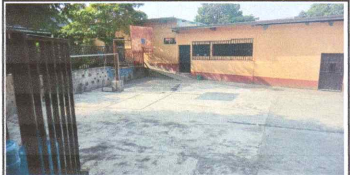
Mantenimiento con Suministro e instalación de cubierta lamina c26