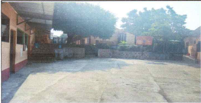
Mantenimiento con Suministro e instalación de estructura metálica en cancha