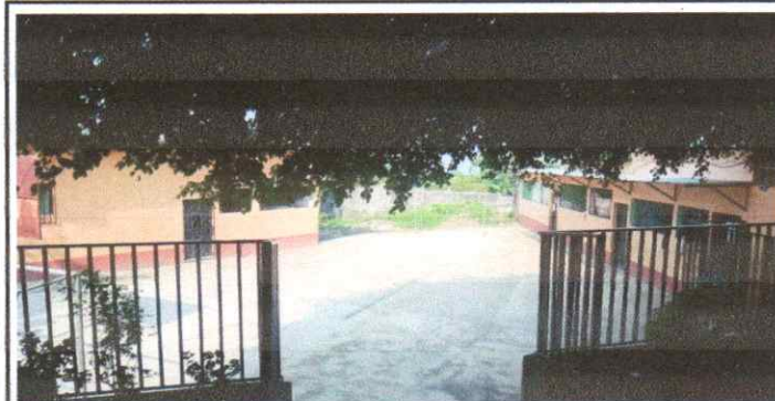
Mantenimiento con Suministro e instalación de estructura metálica en cancha