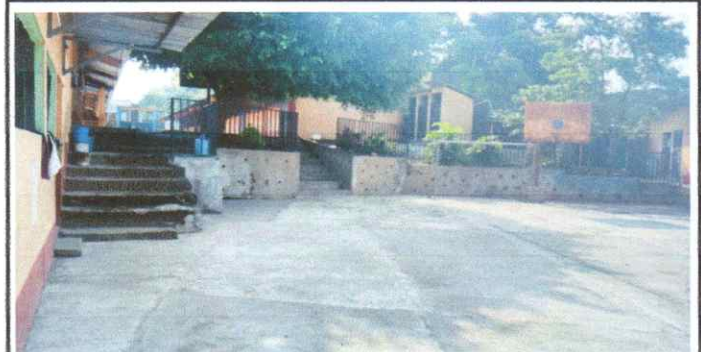
Mantenimiento con Suministro e instalación de cubierta lamina c26

Observación: Si es necesario se pueden agregar hojas adicionales y actualizar el número de hojas.