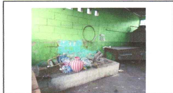
SUSTITUCION DE AZULEJO EN COCINA

Observaciones: En este formulario se pueden agregar hojas adicionales y actualizar el número de hojas.