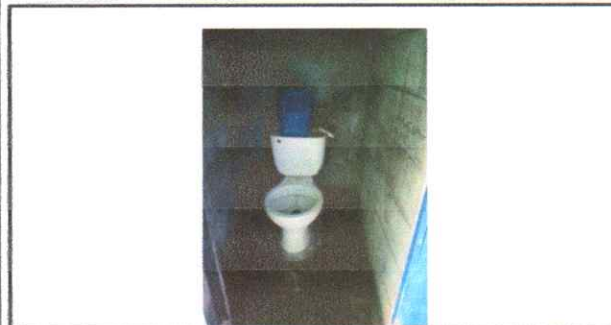
SUSTITUCION DE INODOROS