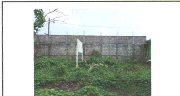
SUSTITUCION DE MURO