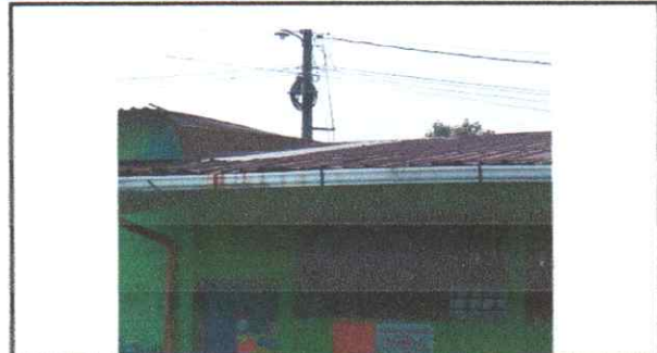
SUSTITUCION DE LAMINA TROQUELADA CALIBRE 26