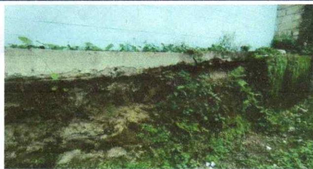
Reparación de muro con Block de concreto de 0.14x0.19x0.39m. Reparación de muro con columnas de 0.15x0.20m 4 hierro 1/2" y estribos 1/4". Sustitución de repello en muro de block.