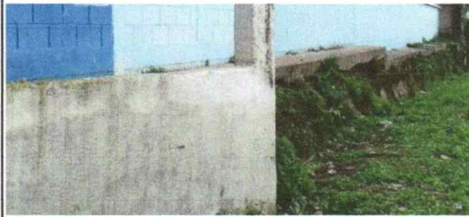
Reparación de muro con Block de concreto de 0.14x0.19x0.39m. Reparación de muro con columnas de 0.15x0.20m 4 hierro 1/2" y estribos 1/4". Sustitución de repello en muro de block.