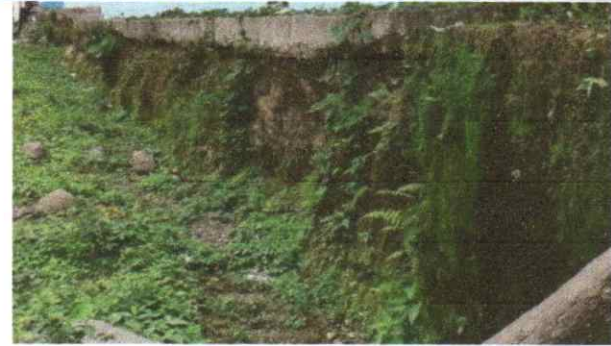
Reparación de muro con Block de concreto de 0.14x0.19x0.39m. Reparación de muro con columnas de 0.15x0.20m 4 hierro 1/2" y estribos 1/4". Sustitución de repello en muro de block.