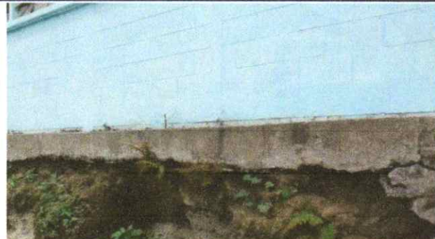
Reparación de muro con Block de concreto de 0.14x0.19x0.39m. Reparación de muro con columnas de 0.15x0.20m 4 hierro 1/2" y estribos 1/4". Sustitución de repello en muro de block.

Observación: Si es necesario se pueden agregar hojas adicionales y actualizar el número de hojas.