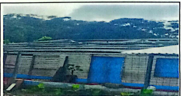
Foto 4: Sustitución de Estructura de soporte actual en mal estado (madera, metal) por metal (costaneras de 4x2 calibre 16 para aulas)