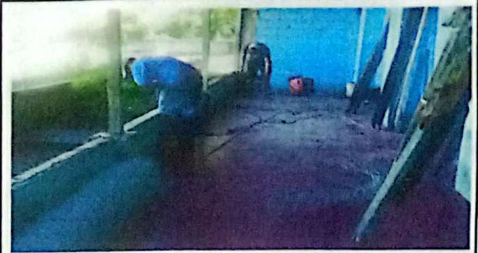
Foto 2: Suministro e Instalacion de malla calibre 13.5 para acercamiento de muro perimetral