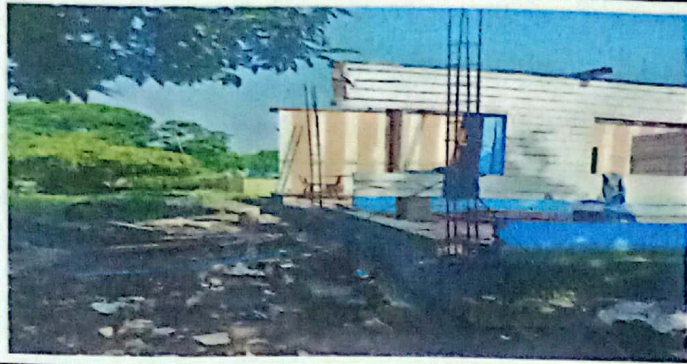
Foto 1: Mantenimiento de Muro de 7.60 de largo x 4 mts de alto en aulas