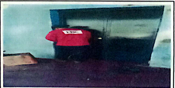
Foto 6: Suministro de puerta de metal de 1.30 de ancho por 2.20 de alto, doble hoja y aplicacion de pintura anticorrosiva.

Observación: Si es necesario se pueden agregar hojas adicionales y actualizar el número de hojas.