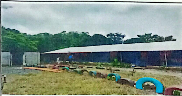
Foto 3: Suministro e instalacion de tubos pvc de 3 para canales y bajadas de agua pluvial