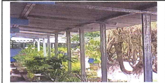
Foto 1: VISTA FACHADA LAMINA COLOCADA AL 100% Y ESTRUCTURA METÁLICA