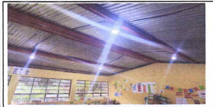
Foto 5: INTERIOR DE LAS AULAS CON INSTALACIÓN ELECTRICA FUNCIONANDO