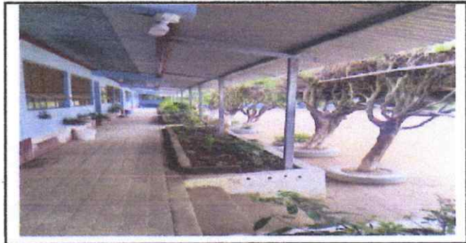
Foto 6: EXTERIOR DE AULAS CON FOCOS INSTALADOS, CORREDOR ENTECHADO.

Observación: Si es necesario se pueden agregar hojas adicionales y actualizar el número de hojas.