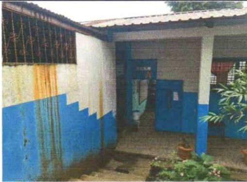
Suministro e instalación de bajadas de agua pluvial