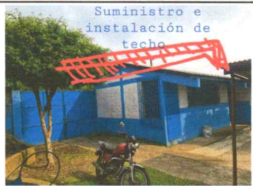
Suministro e instalación de techo en el ingreso principal

Observación: Si es necesario se pueden agregar hojas adicionales y actualizar el número de hojas.