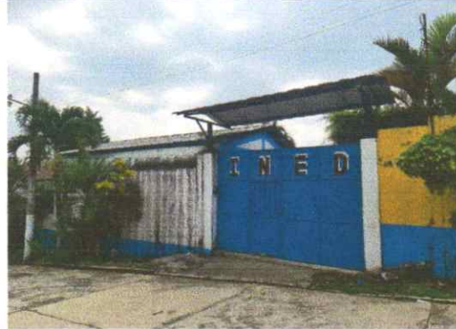
Mantenimiento a estructura del portón principal