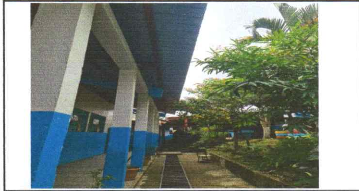
Suministro e instalación de bajadas de agua pluvial