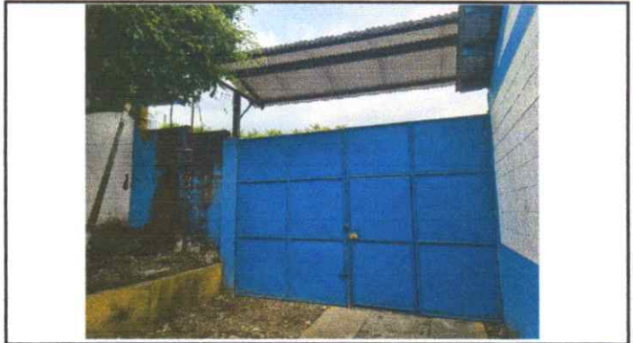
Mantenimiento a estructura del portón principal