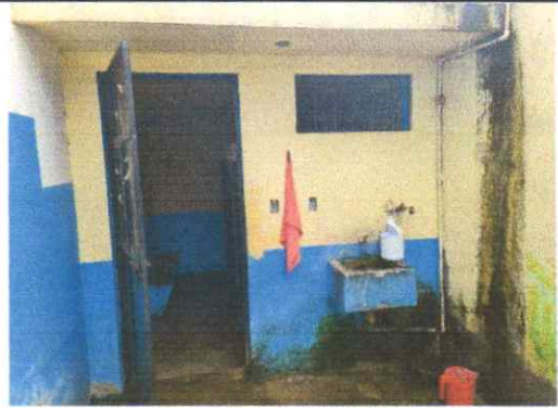
Reparación, sustitución y mantenimiento a servicios sanitarios

Observación: Si es necesario se pueden agregar hojas adicionales y actualizar el número de hojas.