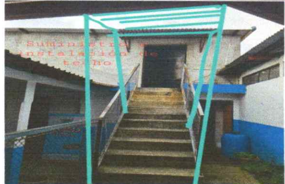
Suministro e instalación de techo en las gradas que dan a la bodega