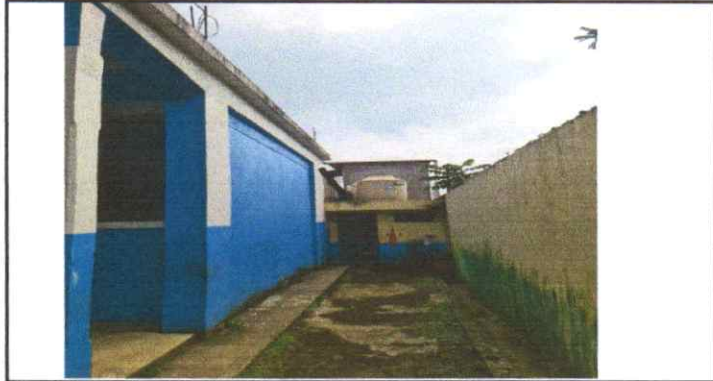
Suministro e instalación de techo frente al sanitario de varones