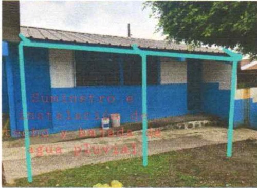
Suministro e instalación de techo para modulo de gradas de ingreso