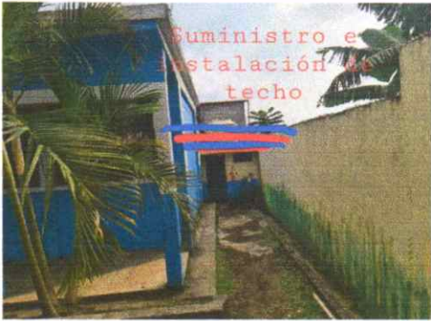
Suministro e instalación de techo frente al sanitario de varones