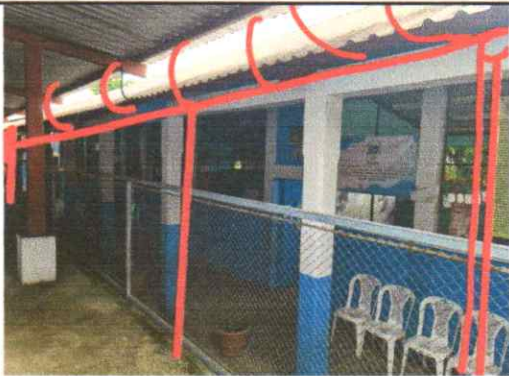
Suministro e instalación de bajadas de agua pluvial