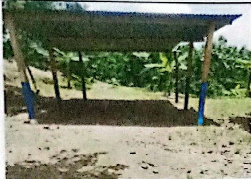
Suministro e instalación de paredes prefabricadas para aula.