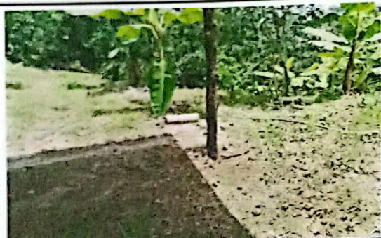
Suministro e instalación de puerta de metal con chapa Yale 1x2.5 m.