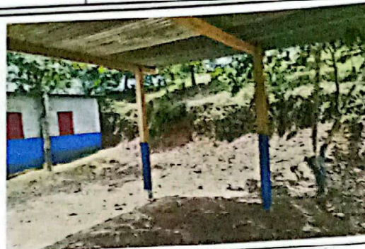
Suministro e instalación de paredes prefabricadas para aula.