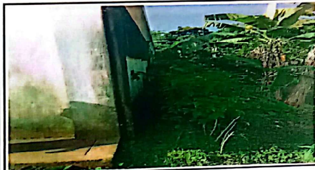
Parte de atrás del establecimiento.