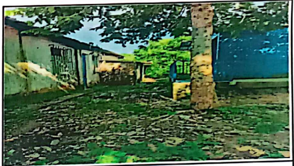
Parte lateral del establecimiento en dirección al sur.