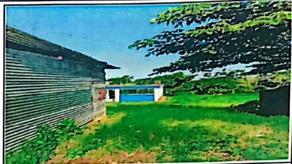
Parte lateral del establecimiento en dirección al norte.