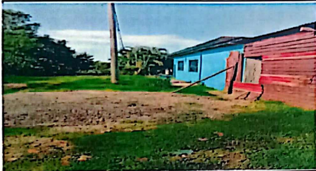
Parte frontal del establecimiento.