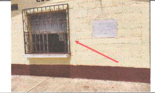
Sustitución de estructura metálica

Observación: Si es necesario se pueden agregar hojas adicionales y actualizar el número de hojas.