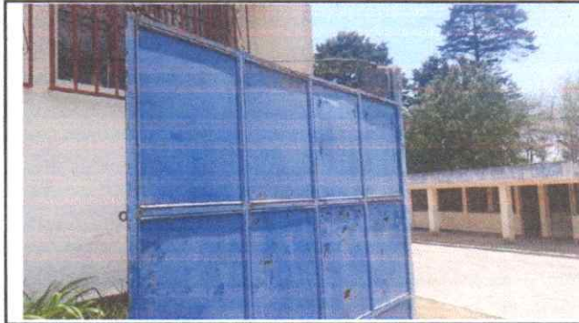
Mantenimiento de puertas