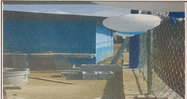
SUMINISTRO Y SUSTITUCION DE PARED DE CONTENCIÓN