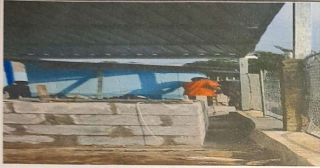
SUMINISTRO Y SUSTITUCION DE PARED DE CONTENCIÓN