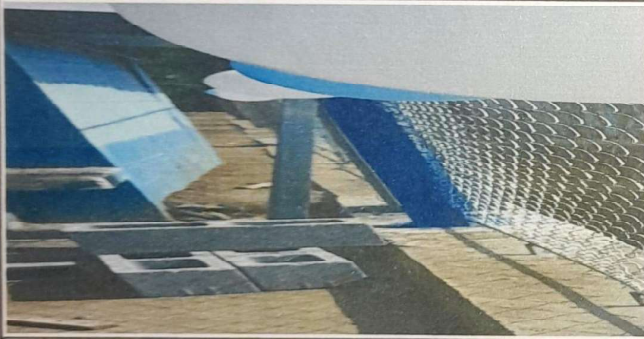
SUMINISTRO Y SUSTITUCION DE PARED DE CONTENCIÓN