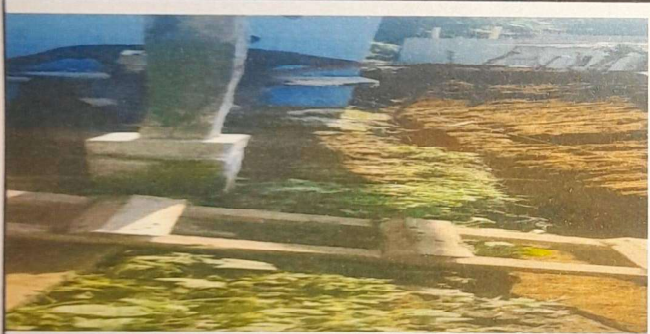
SUMINISTRO Y SUSTITUCION DE MURO DE CONTENCIÓN