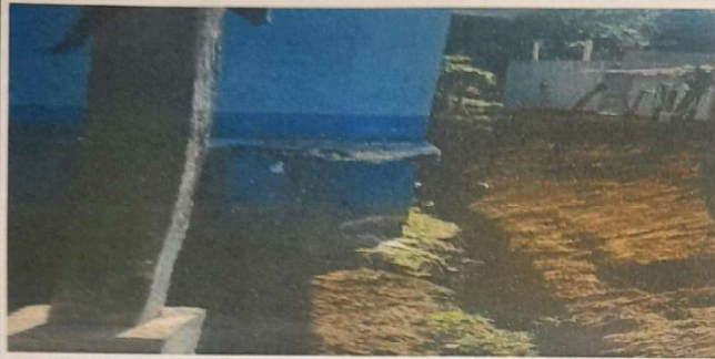
SUMINISTRO Y SUSTITUCION DE MURO DE CONTENCIÓN