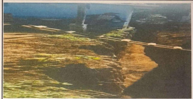
SUMINISTRO Y SUSTITUCION DE MURO DE CONTENCIÓN