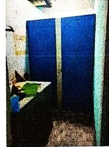
suministro e instalación de puerta metálica de 2.10*0.70.