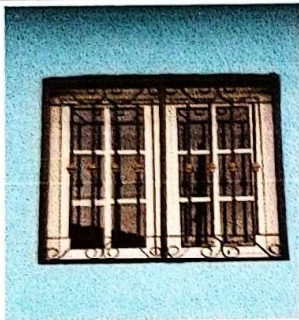
suministro e instalación de ventanas de U.P.V.C corredizas