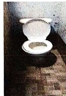
suministro e instalacion de piso ceramico antideslizante, puerta metalica para sanitario.

Observación: Si es necesario se pueden agregar hojas adicionales y actualizar el número de hojas.