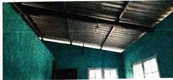
suministro y fabricacion de estructura metlica con costaneras.