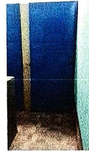
Suministro e instalación de pared en baños

Observación: Si es necesario se pueden agregar hojas adicionales y actualizar el número de hojas.