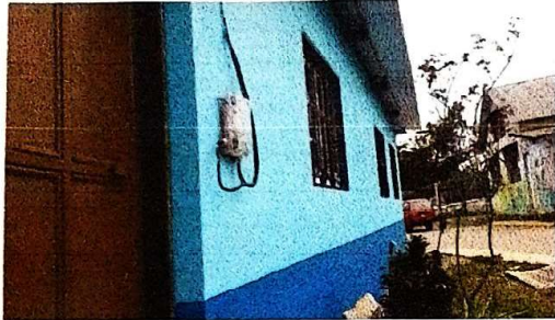
Mantenimiento a muro de aulas, limpieza de pintura más repello a paredes exteriores.