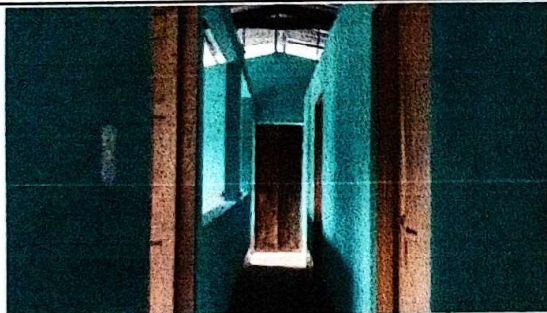
mantenimiento a muros de aulas, limpieza de pintura más repello a paredes interiores