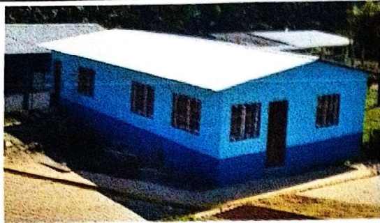
suministro e instalación de bubierta metalica con lamina troquelada calibre 26.