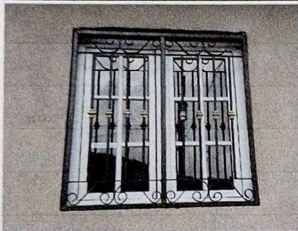
suministro e instalación de ventanas de U.P.V.C corredizas