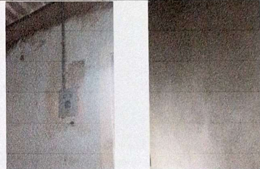
suministro e intalacion electrica iliminacion global.