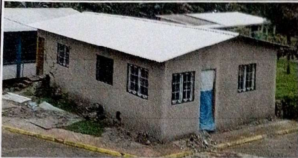
Mantenimiento a muro de aulas, Limpieza de pinturas más repello a paredes exteriores.