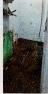
suministro e instalación de puerta metalica de 2.10*0.70.