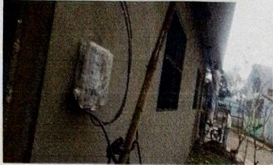
Mantenimiento a muro de aulas, limpieza de pintura más repello a paredes exteriores.