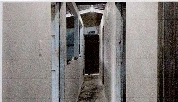
mantenimiento a muros de aulas, limpieza de pintura más repello a paredes interiores