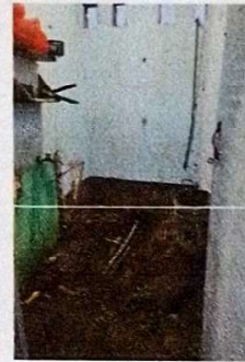
Suministro e instalacion de pared en baños

Observación: Si es necesario se pueden agregar hojas adicionales y actualizar el número de hojas.