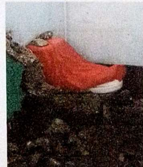
suministro e instalacion de piso ceramico antideslizante, puerta metalica para sanitario.

Observación: Si es necesario se pueden agregar hojas adicionales y actualizar el número de hojas.