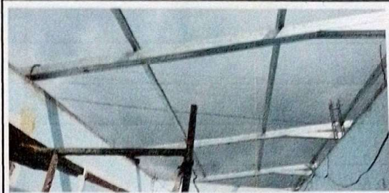
suministro y fabricacion de estructura metlica con costaneras.