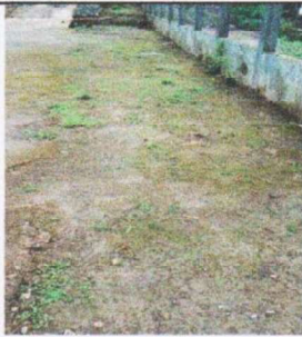
Suministro y sustitución de torta de concreto en patio