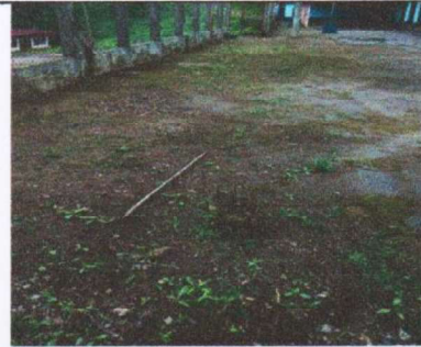
Suministro y sustitución de torta de concreto en patio

Observación: Si es necesario se pueden agregar hojas adicionales y actualizar el número de hojas.