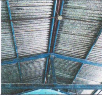
Mantenimiento de estructura metalica para techo de aulas