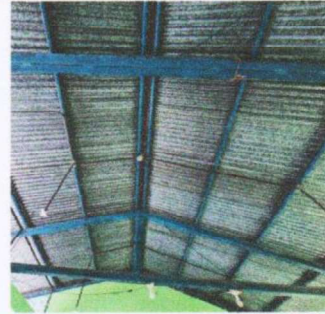
Mantenimiento de estructura metalica para techo de aulas