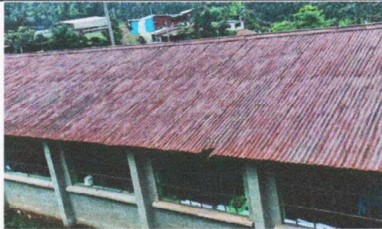
Suministro y sustitución de lamina por lamina acanalada calibre 26