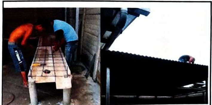
Foto 6: Proceso de fundición del desayunador e instalacion del techo

Observación: Si es necesario se pueden agregar hojas adicionales y actualizar el número de hojas.