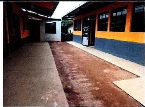
Foto 4: Patio principal donde se fundiría el piso de cemento gris