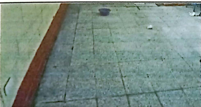
FOTO 5: SUSTITUCIÓN DE PISO DE TORTA DE CONCRETO POR GRANITO 63 M2