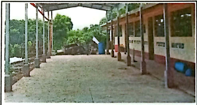
Foto 4: SUMINISTRO E INSTALACION DE DE PISO DE CONCRETO EN AREA DE PATIO 104 M2