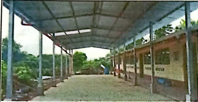
Foto 1: SUMINISTRO E INSTALACIÓN DE ESTRUCTURA METALICA PARA CUBIERTA DE PATIO 104 M2