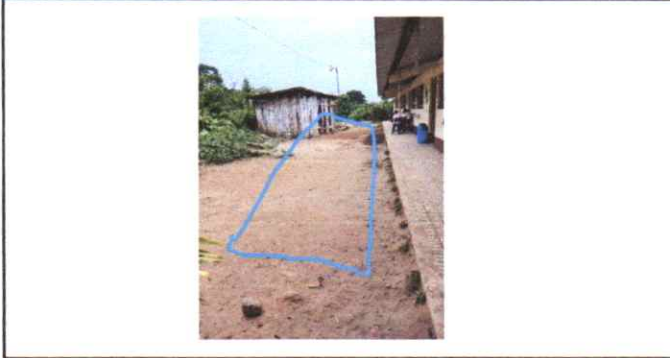
SUMINISTRO E INSTALACIÓN DE ESTRUCTURA METALICA PARA CUBIERTA DE PATIO 104 M2