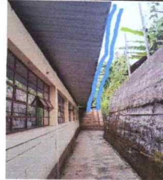
SUMINISTRO E INSTALACIÓN DE CANALES DE PVC 40 MTS