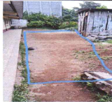
SUMINISTRO DE PISO DE TORTA DE CONCRETO 104 M2

Observación: Si es necesario se pueden agregar hojas adicionales y actualizar el número de hojas.