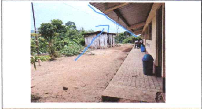
SUMINISTRO E INSTALACIÓN DE CANALES DE PVC 40 MTS