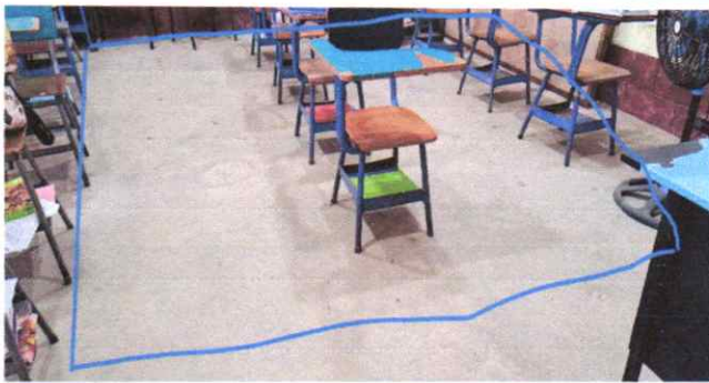
SUSTITUCIÓN DE PISO DE TORTA DE CONCRETO POR GRANITO 63 M2