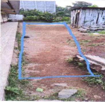
SUMINISTRO E INSTALACIÓN DE ESTRUCTURA METALICA PARA CUBIERTA DE PATIO 104 M2