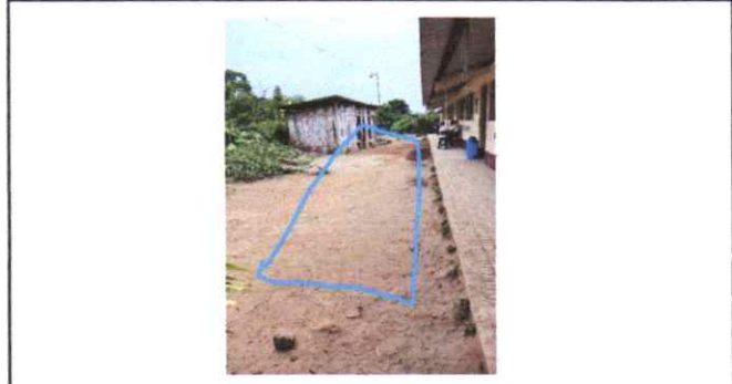
SUMINISTRO DE PISO DE TORTA DE CONCRETO 104 M2

Observación: Si es necesario se pueden agregar hojas adicionales y actualizar el número de hojas.