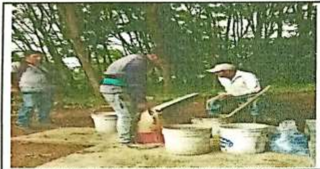
Foto 1: VISTA PREPARANDO LA MEZCLA PARA EL SIMIENTO DE LA PARED