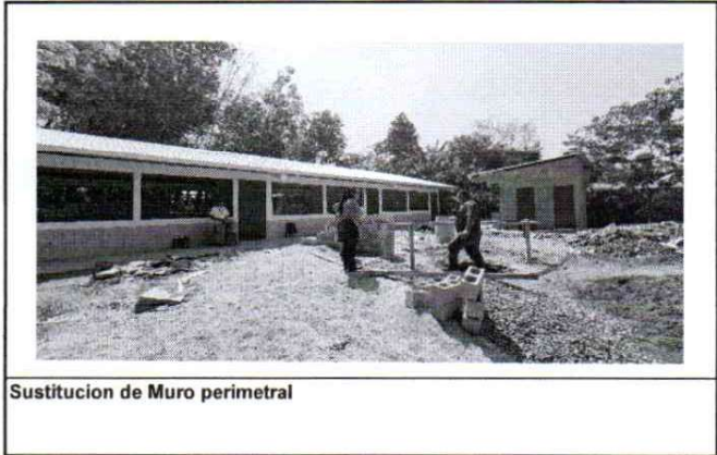
Sustitucion de Muro perimetral