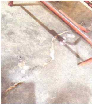
Reparación de piso de cemento a piso de cerámico