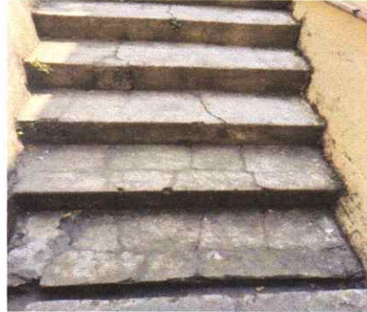
Sustitución de gradas de cemento