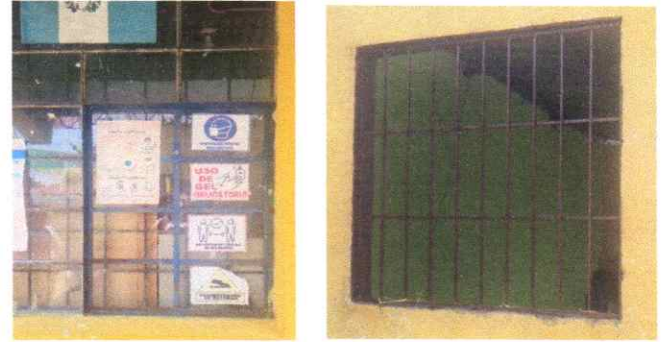
Cambio de ventanas por material de PVC