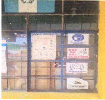
Cambio de ventanas por material de PVC