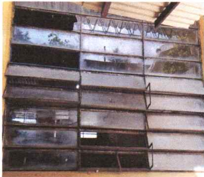
Cambio de ventanas por material de PVC