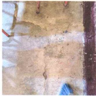
Reparación de piso de cemento por piso cerámica

Observación: Si es necesario se pueden agregar hojas adicionales y actualizar el número de hojas.