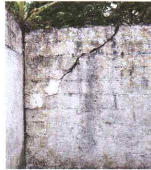
Reparación de muro perimetral

Observación: Si es necesario se pueden agregar hojas adicionales y actualizar el número de hojas.