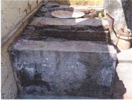
Reparación de plancha de cocina