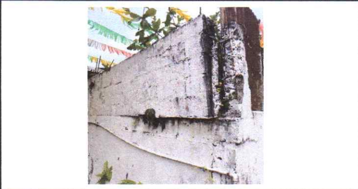
Reconstrucción de pared