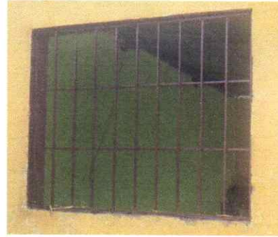
Cambio de ventanas por material de PVC