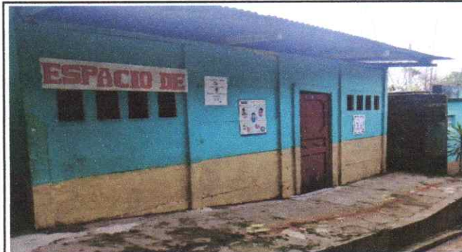
Reparación de piso rustico a piso cerámico.