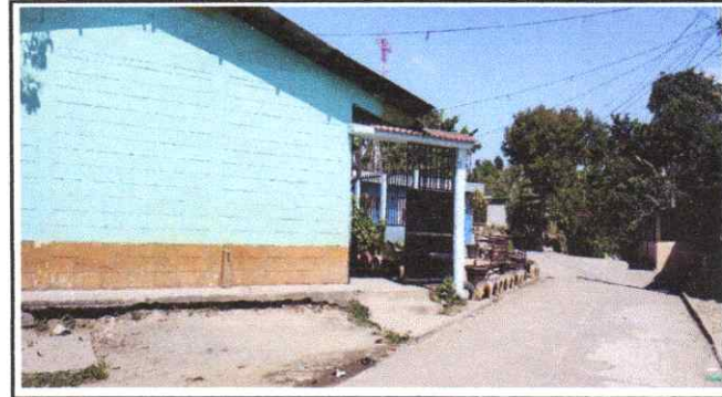
Reparación de fachada

Observación: Si es necesario se pueden agregar hojas adicionales y actualizar el número de hojas.