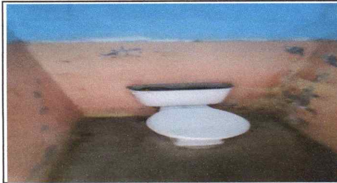
Reparación de taza de sanitario redondas