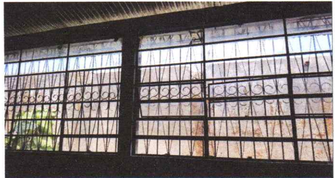
Reparación de ventanas de metal y vidrios