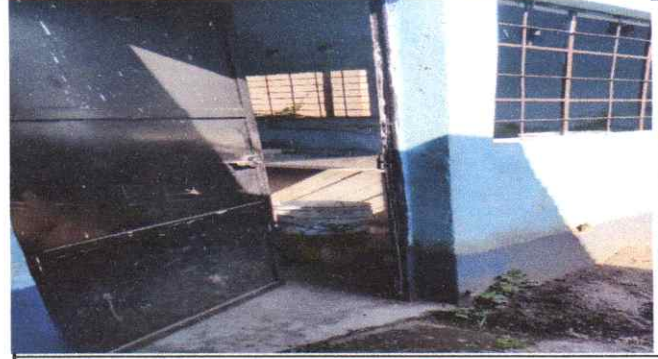
Reparación cambio de puertas y chapas de metal