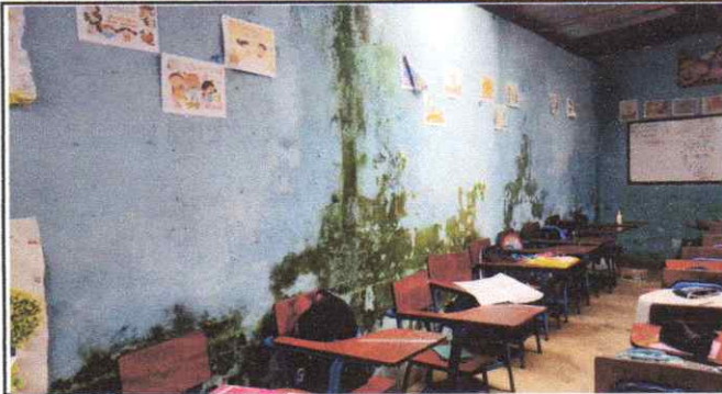
Reparación de muros con repello.