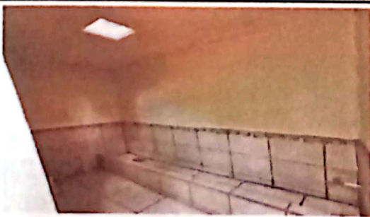
Foto 5: VISTA INTERIOS DE SUMINISTRO E INSTALACIÓN DE MIGITORIO FINALIZADO