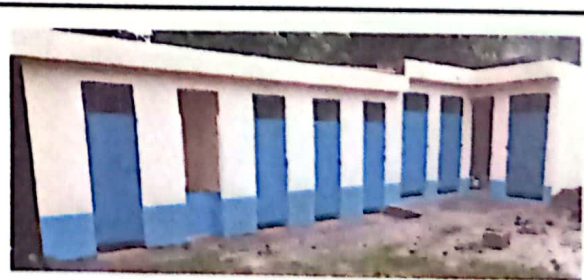
Foto 6: VISTA EXTERIOR DE SANITARIOS CON SUMINISTRO E INSTALACIÓN DE PUERTAS Y PINTURA

Observación: Si es necesario se pueden agregar hojas adicionales y actualizar el número de hojas.