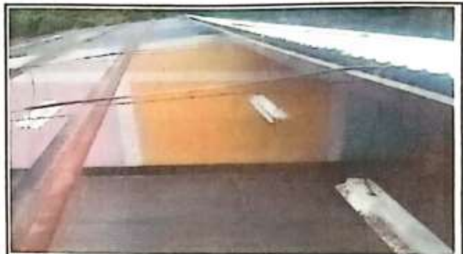
Foto 4: MANTENIMIENTO DE PINTURA EN ESTRUCTURA METALICA EXISTENTE