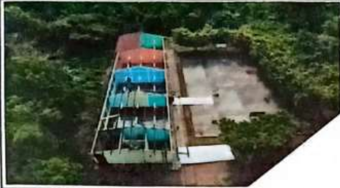
Foto1: RETIRO DE LÁMINAS ANTIGUAS