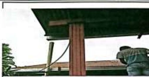
Suministro y sustitución de canales tipo Americano