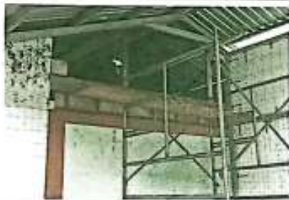
Suministro y reparación de muro de block de dirección, en módulo 2