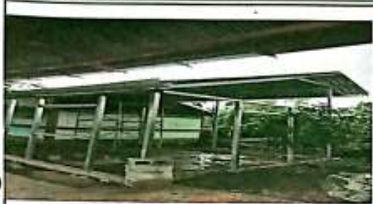
Suministro e instalación de aula prefabricada de 30 m2