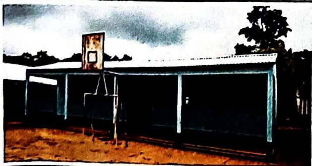
Foto 5: VISTA EXTERIOR DEL SUMINISTRO E INSTALACIÓN DE LAMINAS EN EL PRIMERO Y SEGUNDO MÓDULOS, YA FINALIZADO EN UN 100%