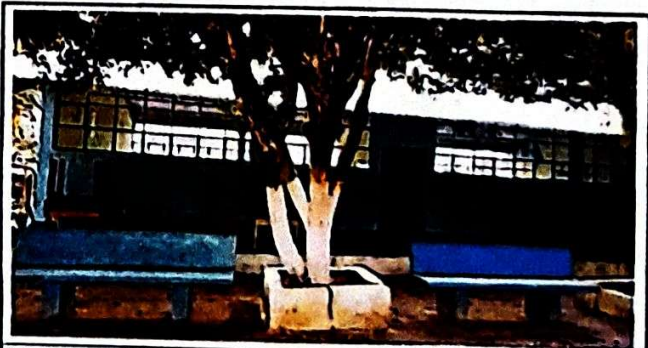
Foto 6: VISTA EXTERIOR DEL SUMINISTRO E INSTALACIÓN DE LAMINAS EN EL TERCER MÓDULO, YA FINALIZADO EN UN 100%

Observación: Si es necesario se pueden agregar hojas adicionales y actualizar el número de hojas.