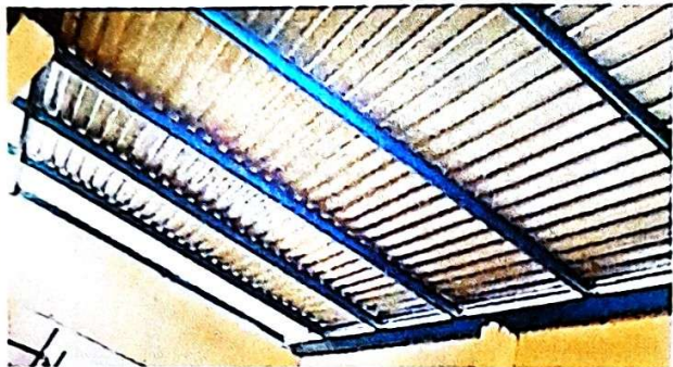
Foto 1: VISTA INTERIOR, LAMINA EN UNA PARTE DEL PRIMER MÓDULO, FINALIZADO AL 100%