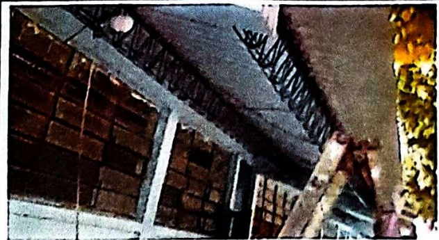
Foto 2: VISTA DE INSTALACIÓN DE LÁMINA EN EL PRIMER MÓDULO, YA FINALIZADO EN UN 100 %