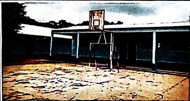
Foto 3: VISTA EXTERIOR DEL SUMINISTRO E INSTALACIÓN DEL PRIMERO Y SEGUNDO MÓDULO, YA FINALIZADOS EN UN 100 %