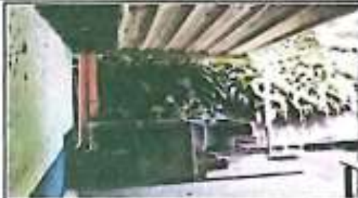
SUSTITUCIÓN DE FILA, CON ACCESORIOS Y TECHO