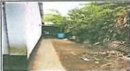
SUMINISTRO E INSTALACION DE CIMENTACION, SUMINISTRO E INSTALACION DE MUROS Y ESTRUCTURAS, SUMINISTRO E INSTALACION DE ESTRUCTURA DE TECHO METALICO EN EL AULA.