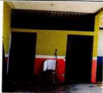
Reparación de puertas de baño, (cambio de lado, cambio de chapa y aplicación de pintura). 0.90 x 2.10