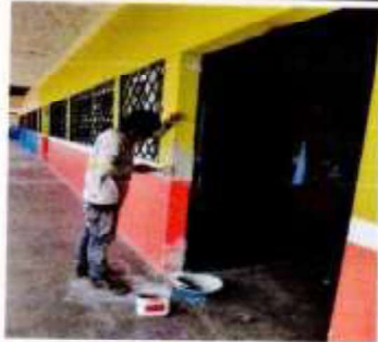
Suministros, fabricación e instalación de puertas de metal de dos hojas 1.45 x 2.10