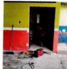
Suministros, verificación y reparación de lavamanos, (grifos y manguera).

Observación: Si es necesario se pueden agregar hojas adicionales y actualizar el número de hojas.