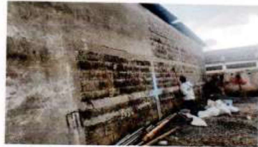
Suministro, trabajo en 79 mts2: limpieza y aplicación de impermeabilizante para exterior parte trasera de 2 aulas