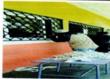
Suministros, fabricación e instalación de ventanas corredizas de pvc blanco con vidrio claro de 5mm 1.08 x 1.04