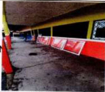
Suministros, fabricación e instalación de ventanas corredizas de pvc blanco con vidrio claro de 5mm 2.80 x 1.04