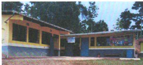
Suministro e instalación de estructura metálica y cubierta de lámina de patio , Suministro e instalación de dos muros