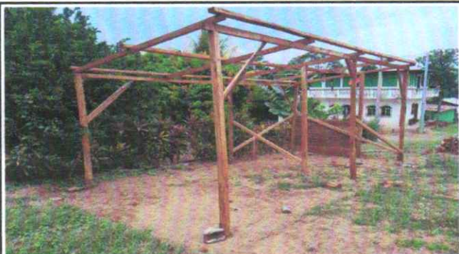
Suministro e instalación de techado de cocina prefabricada y mantenimiento a cubiertas de lámina existente con pintura anticorrosiva