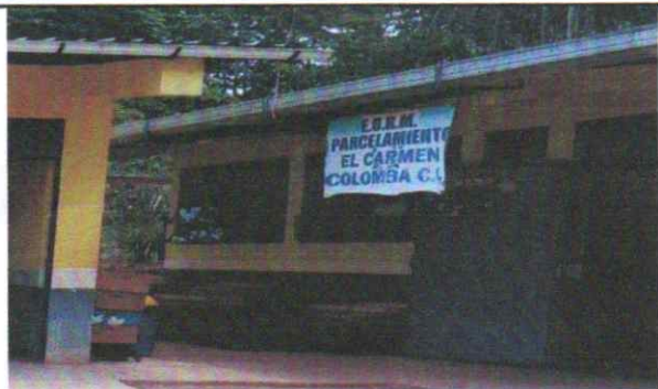
Suministro e instalación de estructura metálica y cubierta de lámina de patio Suministro e instalación de dos muros