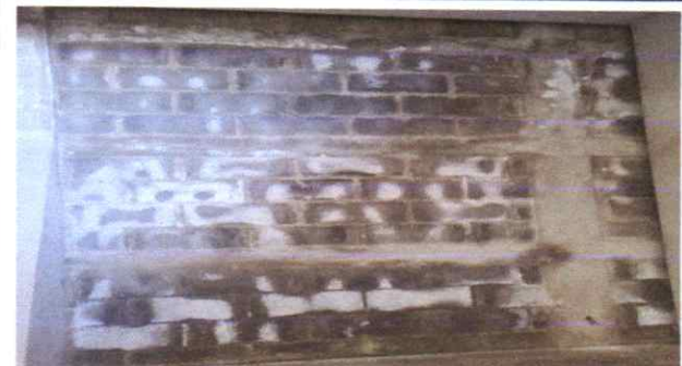
REPARACIÓN DE MUROS CON REPELLO E IMPERMEABILIZACIÓN

Observación: Si es necesario se pueden agregar hojas adicionales y actualizar el número de hojas.