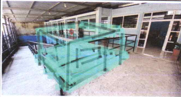
SUSTITUCIÓN DE ESTRUCTURA METÁLICA E INSTALACIÓN DE PANELES DE U.P.V.C.