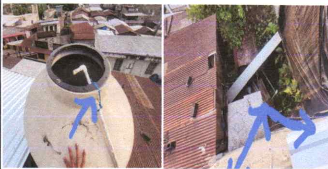
SUSTITUCIÓN DE DEPÓSITO DE AGUA.