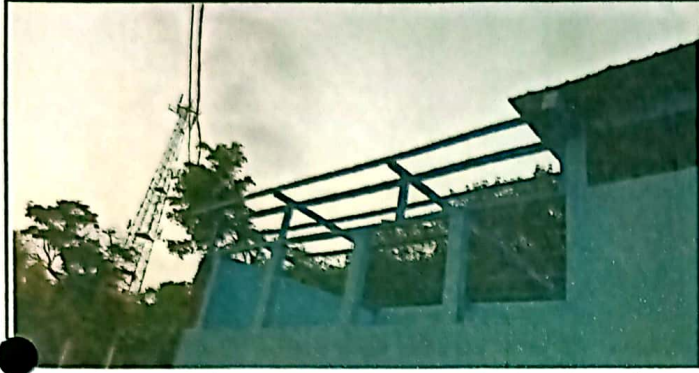
Foto 1: SUMINISTRO DE COSTANERA EN MAL ESTADO POR COSTANERA NUEVA.