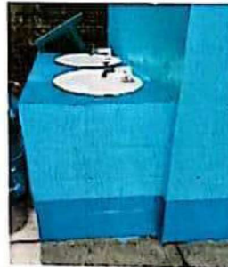
Suministro y reparación de grifos en lavamos

Observación: Si es necesario se pueden agregar hojas adicionales y actualizar el número de hojas.