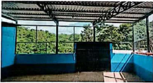
Suministro e instalación de malla en área de patio