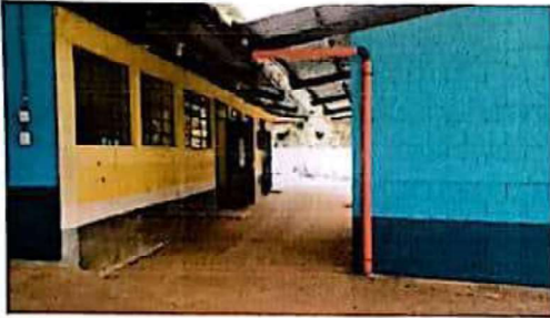
Mantenimiento con pintura anticorrosiva a estructura de ventanas