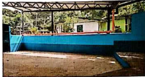
Suministro y aplicación de pintura de aceite en muro perimetral