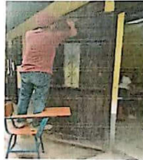
Sustitucion de chapa de puerta con chapa yale