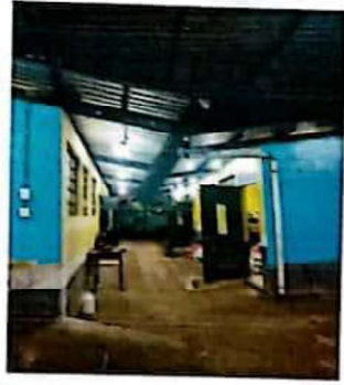
Mantenimiento con pintura anticorrosiva a estructura de ventanas