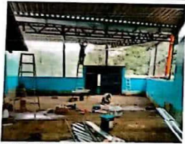
Suministro e instalacion de malla en area de patio