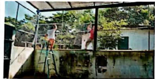
Suministro y aplicación de pintura de aceite en muro perimetral