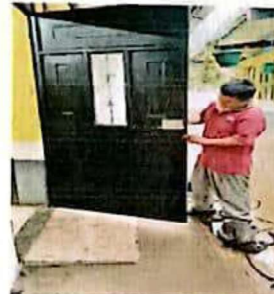
Reparacion de puerta de metal

Observación: Si es necesario se pueden agregar hojas adicionales y actualizar el número de hojas.