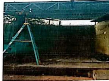
ro e instalacion de lamina troquelada calibre 26