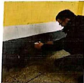
Suministro y sustitucion de sistema electrico