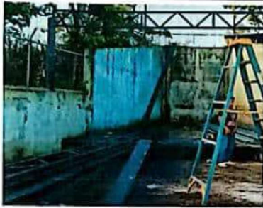
Suministro e instalacion de estructura metalica para techado