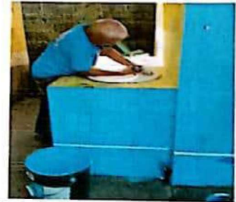
Suministro y reparacion de grifos en lavamos

Observación: Si es necesario se pueden agregar hojas adicionales y actualizar el numero de hojas.